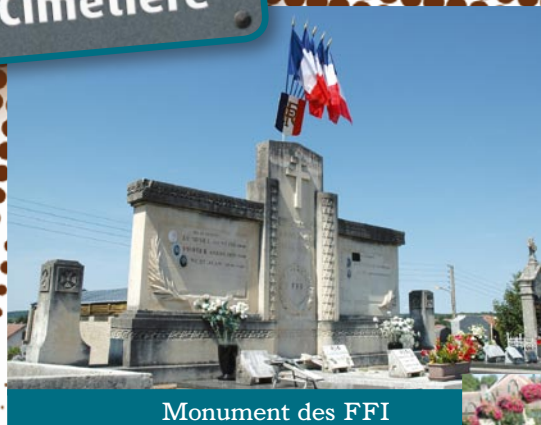
Monument des FFI