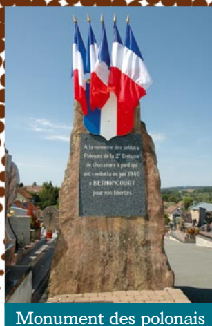
Monument des polonais