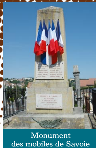
Monument des mobiles de Savoie