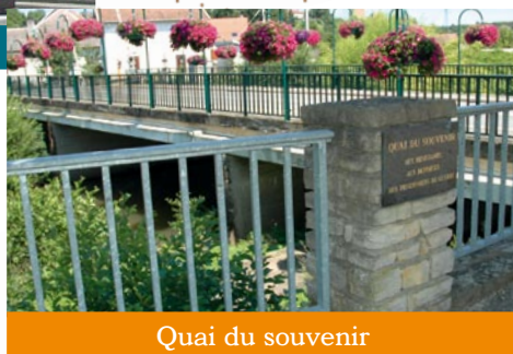
Quai du souvenir