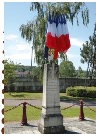
Stèle des résistants