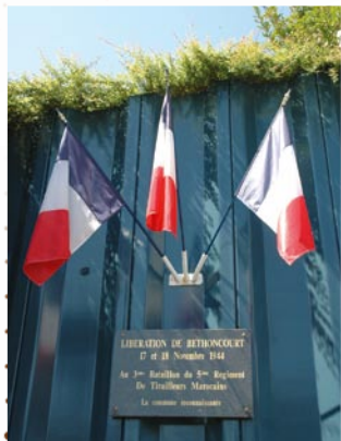
Site commémoratif de la libération de Bethoncourt